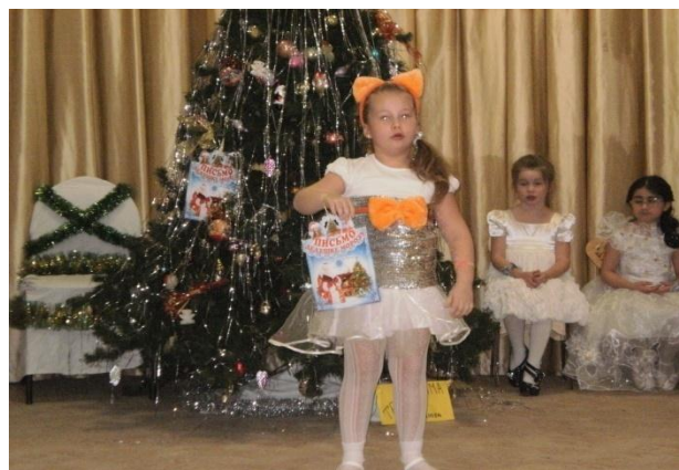
Пришли Святки – пой Колядки